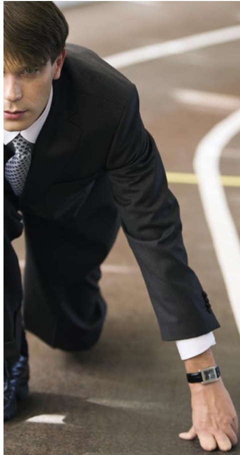
Schweizer Startups sind fit für den globalen Wettstreit.

Gedankenaustausch und Vernetzung gibt es zahlreiche Anlässe. Der bereits erwähnte Web-Monday ist ein solches Event sowie Veranstaltungen wie der Venture Cocktail oder der Venture Apero.